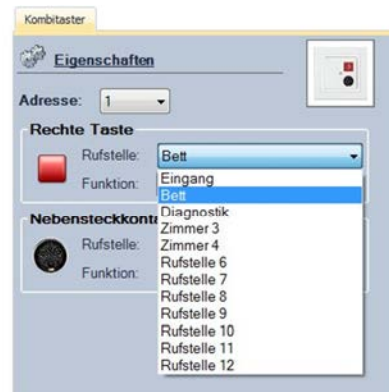
Abbildung 9: Auswahl der Rufstelle

Mit Hilfe des Dropdown-Menüs neben der Bezeichnung „Rufstelle“ kann die Rufstelle ausgewählt werden. Diese Auswahl muss für jede Taste des Tasters separat vorgenommen werden, d.h. handelt es sich z.B. um einen Kombitaster mit Nebensteckkontakt, muss eine Auswahl für die Rufstelle für die grüne Taste, für die rote Taste und für den Nebensteckkontakt getroffen werden.