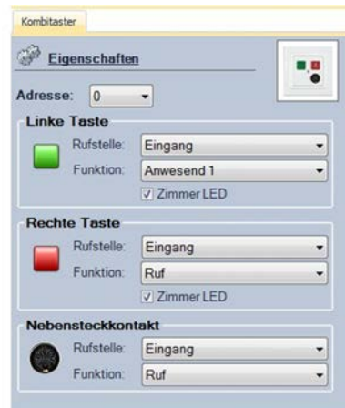
Abbildung 11: Funktion "Zimmer LED"

Bei den ersten 4 Rufstellen gibt es die Möglichkeit diese mit der Einstellung „Zi.LED“ zu versehen. Wird diese Option ausgewählt, leuchten die jeweiligen Tasten auch wenn an einem anderen Taster im Zimmer die jeweilige Rufart ausgelöst wird.