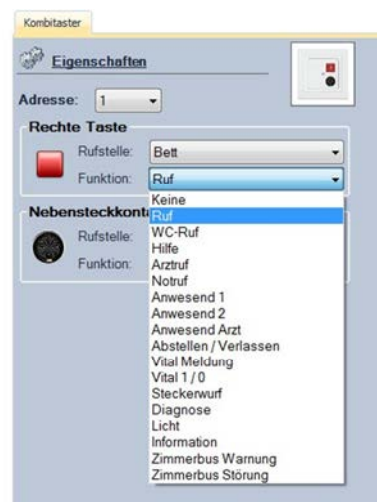
Abbildung 10: Auswahl der Funktion

Mit Hilfe des Dropdown-Menüs neben der Bezeichnung „Funktion“ kann die Funktion ausgewählt werden. Diese Auswahl muss für jede Taste des Tasters separat vorgenommen werden, d.h. handelt es sich z.B. um einen Kombitaster mit Nebensteckkontakt, muss eine Auswahl für die Funktion für die grüne Taste (z.B. „Anwesend1“), für die rote Taste (z.B. „Ruf“) und für den Nebensteckkontakt (z.B. „Ruf“) getroffen werden.