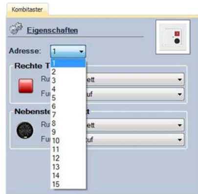
Abbildung 8: Auswahl der Adresse

Die Adresse dient als Kennzeichnung dafür, für welchen Taster die Einstellungen vorgenommen werden. Mit Hilfe des Dropdown-Menüs neben der Bezeichnung „Adresse:“ kann die Adresse frei gewählt werden. Adressen von 0 bis 15 sind zulässig. In dem Beispiel rechts (Abbildung 8) kann die Adresse 0 nicht mehr ausgewählt werden, da bereits ein Kombitaster mit der Adresse 0 an diesem Modul eingerichtet wurde.