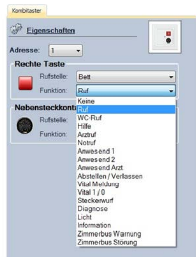
Abbildung 9: Auswahl der Funktion

Mit Hilfe des Dropdown-Menüs neben der Bezeichnung „Funktion“ kann die Funktion ausgewählt werden. Diese Auswahl muss für jede Taste des Tasters separat vorgenommen werden, d.h. handelt es sich z.B. um einen Kombitaster, muss eine Auswahl für die Funktion für die grüne Taste (z.B. „Anwesend1“) und für die rote Taste (z.B. „Ruf“) getroffen werden.