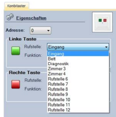
Abbildung 8: Auswahl der Rufstelle

Mit Hilfe des Dropdown-Menüs neben der Bezeichnung „Rufstelle“ kann die Rufstelle ausgewählt werden. Diese Auswahl muss für jede Taste des Tasters separat vorgenommen werden, d.h. handelt es sich z.B. um einen Kombitaster, muss eine Auswahl für die Rufstelle für die grüne Taste und für die rote Taste getroffen werden.