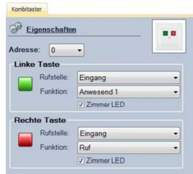
Abbildung 10: Funktion "Zimmer LED"

Bei den ersten 4 Rufstellen gibt es die Möglichkeit diese mit der Einstellung „Zi.LED“ zu versehen. Wird diese Option ausgewählt, leuchten die jeweiligen Tasten auch wenn an einem anderen Taster im Zimmer die jeweilige Rufart ausgelöst wird.